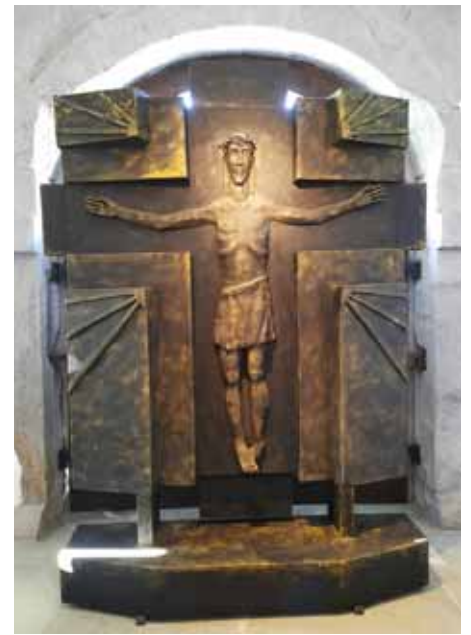
Poklon vstajenskemu Kristusu