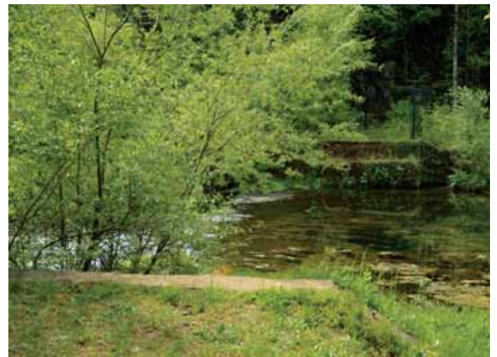
Betonska temelja še vedno nakazujeta, kje je nekdanji most.

Nekaj metrov nižje od nekdanjega mostu, na katerega še spominjajo trdni betonski temelji na obeh brežinah, so v sklopu projekta SORIKO zgradili novo merilno postajo. Tudi to je bila dobra priložnost za nov most, z drugo morda še sprejemljivejšo traso za varstveni pas, a