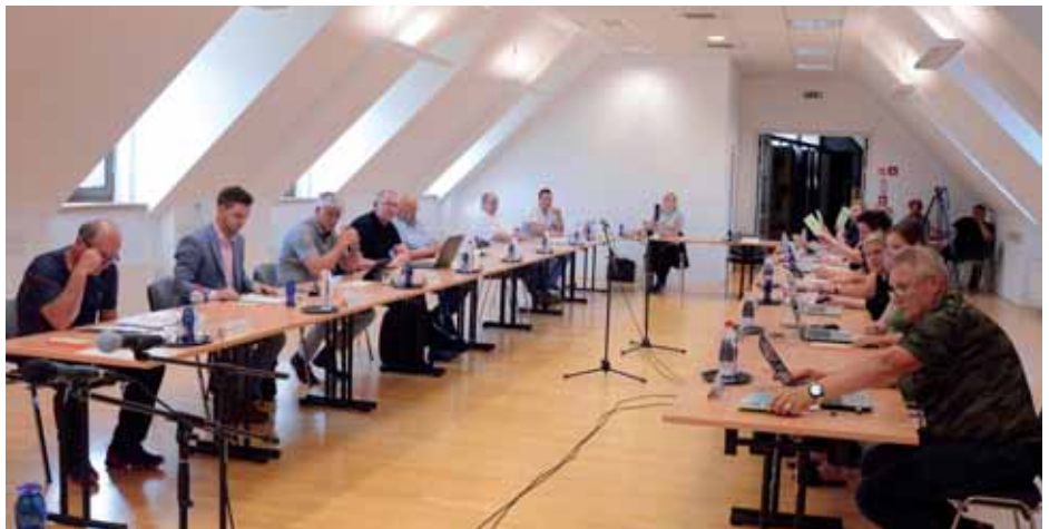
10. redna seja