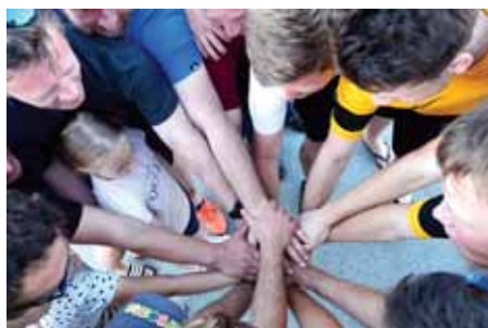
Timski duh zmagovalcev

Tradicionalni prvomajski turnir v malem nogometu v Dolenji vasi, ki poteka vse od leta 1990, so bili organizatorji ŠTD Lončar primorani prestaviti na 13. junij. Sedem ekip iz KS Dolenja vas je prikazalo vrhunske predstave, zmagala je ekipa iz Humca.