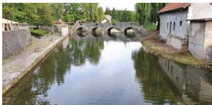
Bistrica leta 2020