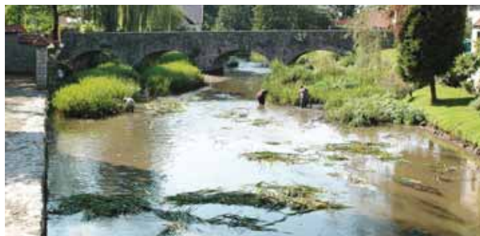
Bistrica leta 2014

Seveda so med deli bile prisotne tudi nekatere kritike s strani občanov, češ da bi morali očistiti več in globlje, kar pa žal ne gre. Očistil se osnovni nanos proda in mulja, ko je stroj dosegel glino, pa je moral