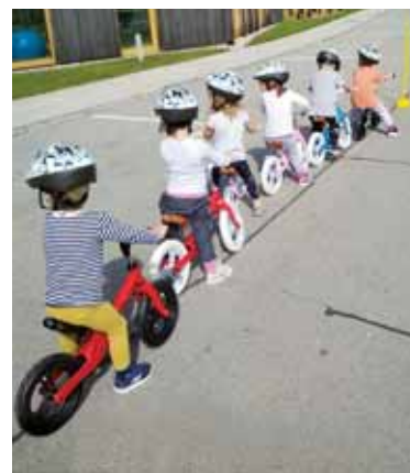
Otroci na novih poganjalcih

Ob upoštevanju zdravstvenih navodil, ki jih je Nacionalni inštitut za javno zdravje predpisal v času epidemije covid-19, je delo tudi v javnih zavodih, ki jih je ustanovila Občina Ribnica, potekalo v skladu z njimi. V šoli in vrtcu so učenci oziroma otroci ostali doma, ta čas pa so vodstva zavoda v sodelovanju z občino izkoristila za sanacijo nekaterih prostorov v vrtcu oziroma nadaljevanje odstranjevanja