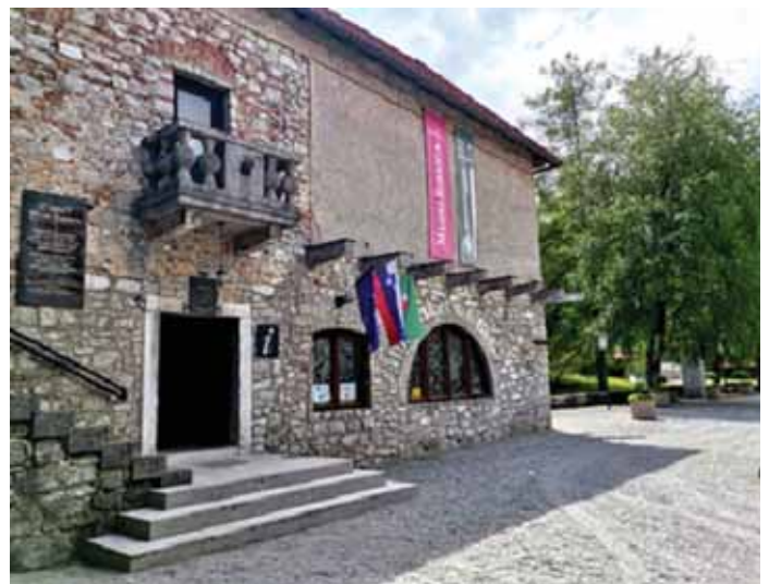
Lokacija INFO točke v čudovitem grajskem ambientu

Ste vedeli, da stoji globoko v Mali gori stara hruška, kjer so se srečevali tihotapci na svojih pohodih? V deblu hruške so si namreč izmenjevali tobak, ki je stoletja nazaj veljal za dragocen tovar. Pot do