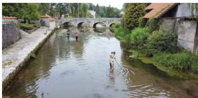
Bistrica leta 2018