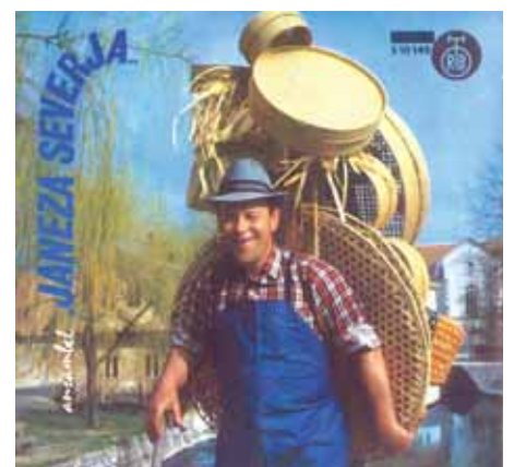
Ansambel Janeza Severja, mala plošča, 1972.

Drugi ansambel, ansambel Janeza Severja, pa je za ovitek plošče uporabil fotografijo ribniškega krošnjarja, slikanega na francoskem mostu, v ozadju je vidna ribniška cerkev, ob bregu Bistrice pa še mlada vrba in klopca ob njej. Ta mala plošča je bila posneta davnega leta 1972 v produkciji gramofonskih plošč Radio-televizije Beograd in na njej sta le dve pesmi: polka Proti Ribnici in valček Za triglavskimi gorami . Plošča je bila posneta po nastopu na Ptujskem festivalu