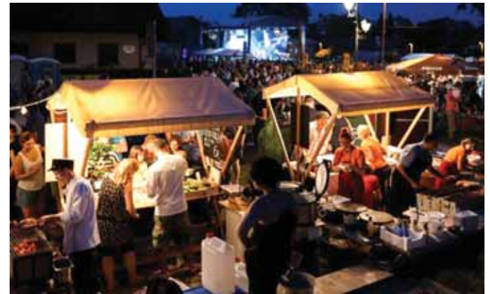
Kuhinja na ulici

upoštevati mnenja lastnikov in najemnikov prostorov. Pomemben vidik je bila tudi jasna in realna slika stanja, ki je lastnikom kljub njihovi izključni pravici do lastnine dala vedeti, da se objekti ne nahajajo v mondenih ali večjih urbanih središčih, temveč da živimo v kraju z le nekaj več kot 3500 prebivalci. Temu primerna je bila tudi okvirna cena najmnin, ki se je morala znižati za polovico, da bi lahko sploh poskušali pridobivati potencialne najemnike. Z veliko mero zaupanja, sodelovanja, angažiranosti nove občinske sile in upoštevanja mnenj so našli skupne točke, ki so začrtale smernice razvoja mestnega jedra. Zavedali so se, da je ključna tudi ureditev upočasnjene-