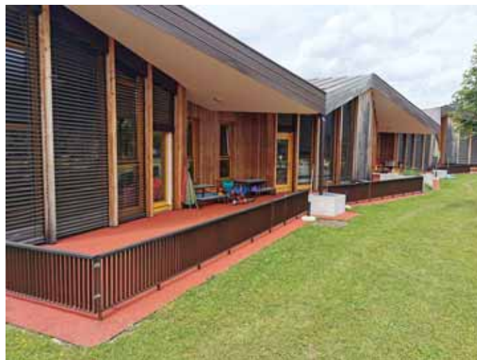
Tartan namesto macesnovih podnic

Ob upoštevanju zdravstvenih navodil, ki jih je Nacionalni inštitut za javno zdravje predpisal v času epidemije covid-19, je delo tudi v javnih zavodih, ki jih je ustanovila Občina Ribnica, potekalo v skladu z njimi. V šoli in vrtcu so učenci oziroma otroci ostali doma, ta čas pa so vodstva zavoda v sodelovanju z občino izkoristila za sanacijo nekaterih prostorov v vrtcu oziroma nadaljevanje odstranjevanja