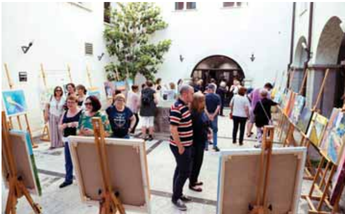
Razstave v skritih dvoriščih

ga enosmernega prometa skozi mestno jedro, z odstavnimi parkirnimi mesti, urejeno talno in svetlobno označbo vseh javnih površin. Pri pripravi in pridobivanju vseh dovoljenj so istočasno pomagali pri iskanju novih najemnikov. Pripravili so celoten seznam ponujenih in praznih prostorov in objektov ter jih intenzivno širše oglaševali in s tem pomagali najti nove najemnike. Glede na takratno ponudbo trgovin in storitvene dejavnosti so imeli ves čas v mislih, kaj še potrebujemo v Ribnici. V sodelovanju lastnikov in občine so ti pripravili večkratne »hitre zmenke« oziroma sestanke med ponudniki prostorov in novimi najemniki, kjer so jim ti predstavili svojo dejavnost in aktivnosti v praznih prostorih. Številni lastniki so se bili v želji po pridobitvi novega stalnega najemnika pripravljene odpovedati najemnini za nekaj mesecev ali celo leto. Pri plačevanju najmnin se je občina še bolj približala najemnikom in priskočila na pomoč pri subvencioniranju najmnin za določen znesek, v nekaterih primerih celo do polovice mesečne najmnine. Tako se je v središču odprlo kar