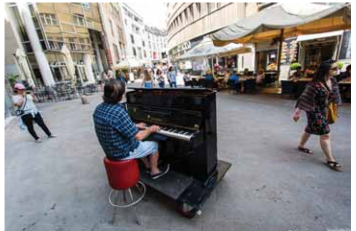
Koncert na cesti

posameznikom, ki željo sodelovati. Vsi ponudniki v mestnem jedru so se povezali v mestno iniciativo in s skupnimi letaki skupaj z občino sedaj vabijo prebivalce k obisku mesta. Sami so se zavedeli, da morajo narediti vse in še več, da si pridobijo kupce na svojo stran. Občina Ribnica jim je tudi zagotovila brezplačno oglaševanje v časopisu Rešeto. Prav tako se je pobudam za oživetje mestnega jedra aktivno pridružila tudi ribniška župnija, ki prireja številne koncerte sakralne glasbe, različne sestave glasbenih in komornih zased v prečudoviti cerkvi sv. Štefana. Vsak posamezni ponudnik se je zavedal, da je košček mozaika, ki sestavlja uspešno zgodbo mestnega jedra. Predvsem pa so zadovoljstvo v veliki meri pokazali prebivalci Ribnice, ki z veseljem obiskujejo mestno središče, številne dogodke; spoznali so, da imamo lepo mesto, lepe priložnosti tudi doma, predvsem pa, da podpiramo domače ponudnike in ne nosimo denarja samo na obrobje v tuje trgovine, kjer denar – izkupiček še isti večer zapusti Slovenijo. Imejmo radi svoje mesto.