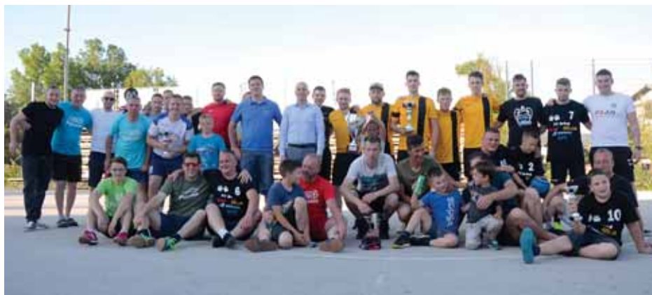
Prve štiri ekipe

Tradicionalni prvomajski turnir v malem nogometu v Dolenji vasi, ki poteka vse od leta 1990, so bili organizatorji ŠTD Lončar primorani prestaviti na 13. junij. Sedem ekip iz KS Dolenja vas je prikazalo vrhunske predstave, zmagala je ekipa iz Humca.