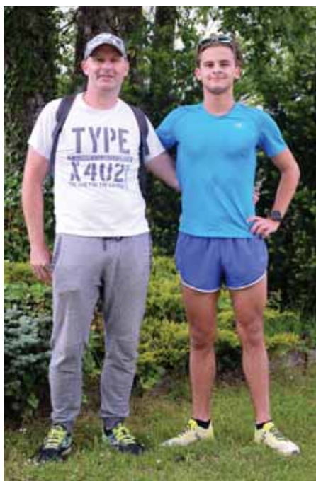
Oče in sin