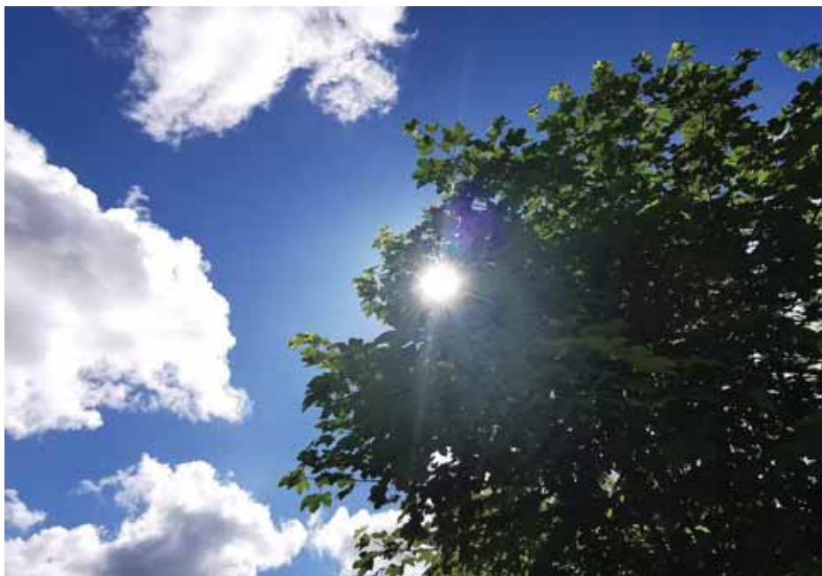
Tabela: Obdobje od 15. maja do 15. junija na vremenski postaji Prigorica

Eden izmed razlogov, zakaj se Slovenija segreva dvakrat hitreje od svetovnega povprečja, je razporeditev kopnega in morja. Nad oceani se namreč ozračje segreva precej počasneje kot nad kopnim. Poenostavljeno povedano, manjši kot je vpliv oceana, hitreje je segrevanje ozračja. Podnebne spre-