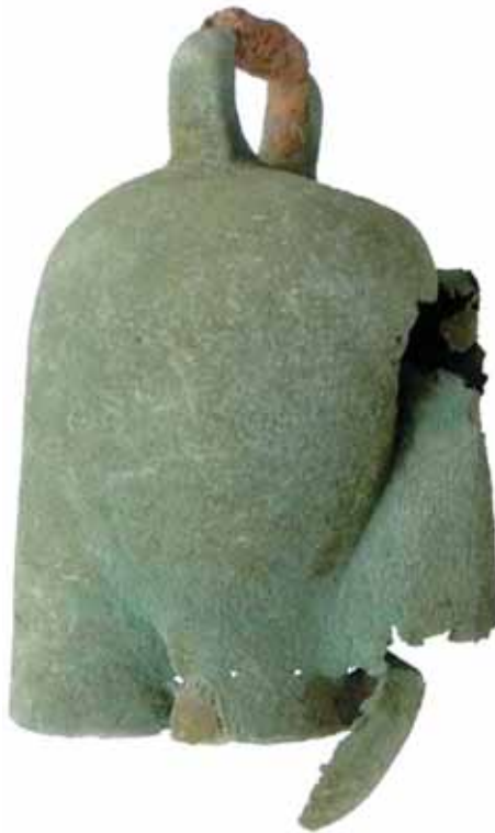
Prigorica pri Ribnici, rimskodobni zvonec z železnim kembljem.

Na podlagi najdb podobnih večjih zvoncev z višinskih naselbin (Unec, Polhograjska gora), Ulake in drugih najdišč jih lahko previdno povežemo z obstojem sistema signalnega obveščanja (Horvat, Lazar in Gaspari 2020, 158). Takšni zvonci so datirani v poznorimsko obdobje in naj bi se v času rimskega obdobja uporabljali v različne namene, vse od kulturnih pa do opozorilnih, ter na vlečnih in jezdni živilih, medtem, ko so se železni zvonci uporabljali predvsem za pašno živino (Božič 2005, 315–319). V rimskem obdobju so zvonce izdelovali iz različnih kovin, med drugimi tudi iz železa. Uporabljali so jih tako za nakit kot za glasbila, pa tudi v magiji, ob verskih in kulturnih obredih.