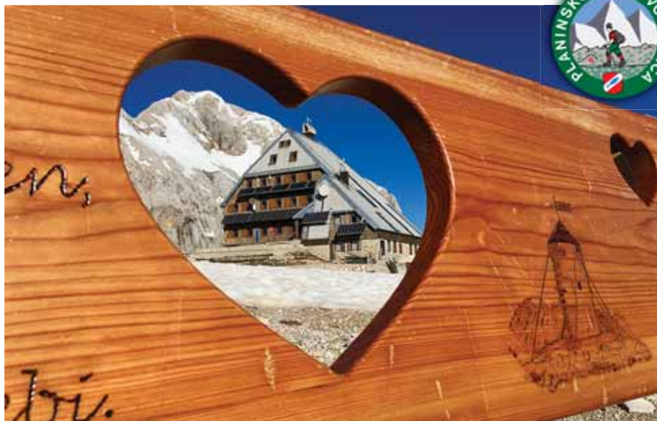
Triglavski dom na Kredarici pod našim očakom Triglavom je odprt in polno oskrbovan od 20. junija.

PZS skupaj s Siol.net že šesto leto pripravlja projekt Naj planinska kočica . Izbirate lahko med 156 planinskimi kočami, med njimi tudi za Planinsko kočico pri Sv. Ani na Mali gori našega PD Ribnica. Glasovanje poteka na spletnem portalu Siol.net: https://siol.net/sportal/naj-planinska-koca/naj-koca-2020-katera-planinska-postojanka-vam-je-najljubša-526678 .